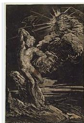
Giovanni Benedetto Castiglione, La Création d'Adam (vers 1642), monotype, Art Institute of Chicago.

On encre/ peint entièrement la plaque/la feuille/du carton avec la peinture choisie, on peut effectuer quelques lignes, mouiller ou enlever partiellement la peinture, puis on pose dessus le support papier ou toile, on appuie alors sur le support, à la main ou à l'aide d'un outil, plus ou moins légèrement, afin d'imprimer plus ou moins, on dessine de la même façon avec outil ou non... Attention, on obtient un résultat à l'envers !