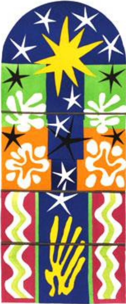
La nuit de Noël , Henri Matisse, 1952 gouache sur papier, 271,8 x 135,9 cm

Voici une œuvre dans un registre plus contemporain et abstrait, "La nuit de Noël" de Henri Matisse. L'artiste a réalisé ce projet de vitrail dans les dernières années de sa vie. Cette œuvre, qui, au départ, était un collage, a été reproduite sur verre et sous forme de lithographies.