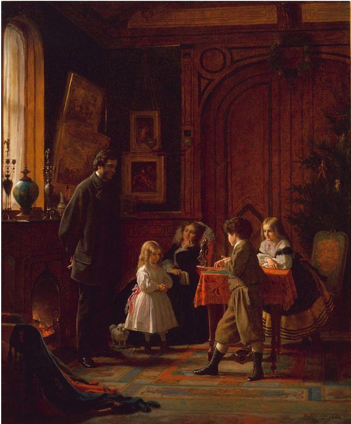
Christmas-Time , Eastman Johnson, 1864, huile sur toile 76,2 X 63,5 cm

Cette peinture portrait de groupe avec des éléments narratifs a été commandée par le père de cette famille : William Tilden Blodgett, un des fondateurs du Metropolitan Museum de New York ; ce tableau est d'ailleurs conservé dans ce grand musée américain.