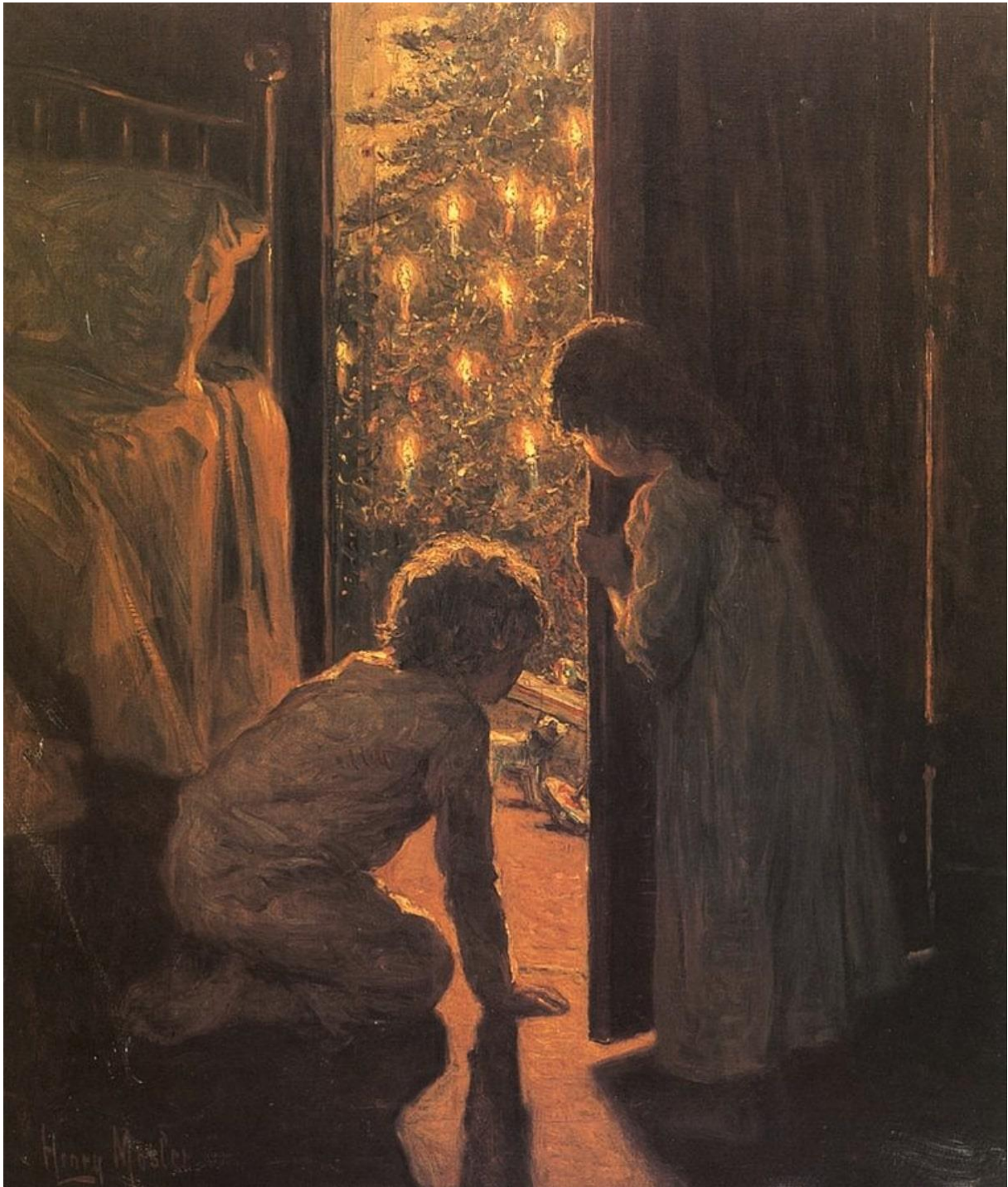
Christmas Morning , Henry Mosler, 1916

Dans ce tableau baigné d'une chaude lumière, le peintre américain Henry Mosler a représenté l'un des moments de l'année les plus attendus par les enfants : le matin de Noël. Ces deux petits sont déjà prêts à découvrir ce que le Père Noël leur a apporté, une scène magnifique ! Dans une scène chaude et chaleureuse, l'artiste a peint deux enfants ouvrant la porte de leur chambre le matin de Noël. On ressent toute l'émotion de cette scène par la timidité des enfants qui regardent discrètement le sapin et les cadeaux.