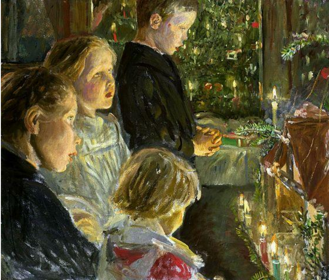
Enfants près de l'arbre de Noël , Léopold Von Kalkreuth, 1901, peinture à l'huile, 41,5 x 49 cm

Le tableau d'aujourd'hui n'est pas très connu. En réalité, il est même difficile de trouver des informations à son sujet. Nous apercevons une scène familiale à l'atmosphère chaleureuse se déroulant pendant les vacances de Noël - des enfants sont réunis autour d'un sapin de Noël, chantant et priant. Ils semblent très concentrés.