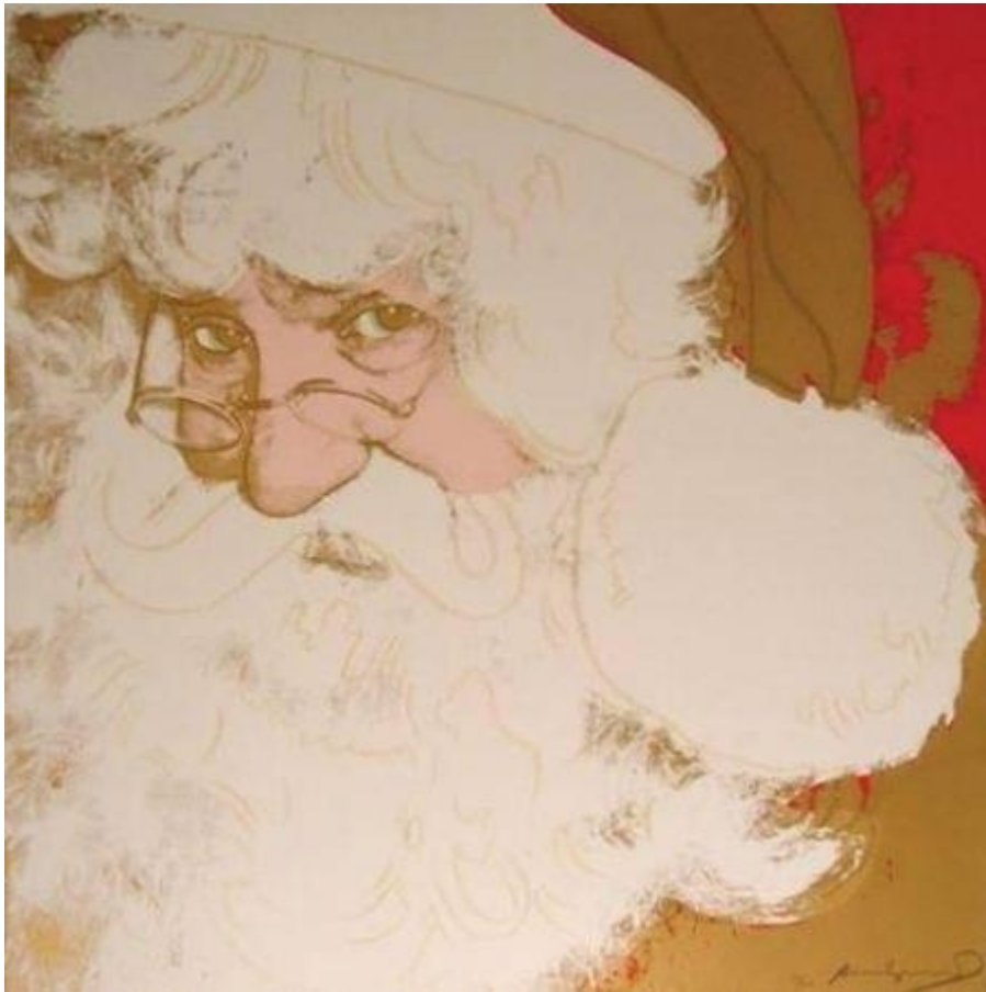
Andy WARHOL, Santa Claus 266 , 1981, Sérigraphie 96,5 x 96,5 cm 2002 tirages

Santa Claus 266 d'Andy Warhol est l'une des dix sérigraphies du portfolio Mythes de l'artiste créé en 1981. Les sujets de ses sérigraphies sont des icônes culturelles mondialement reconnues, bien qu'elles proviennent des pages d'histoires fantastiques, de contes allégoriques et du folklore bien-aimés, tous largement popularisés par les médias. L'artiste démontre à travers ses œuvres que n'importe qui, réel ou imaginaire, peut être une célébrité.