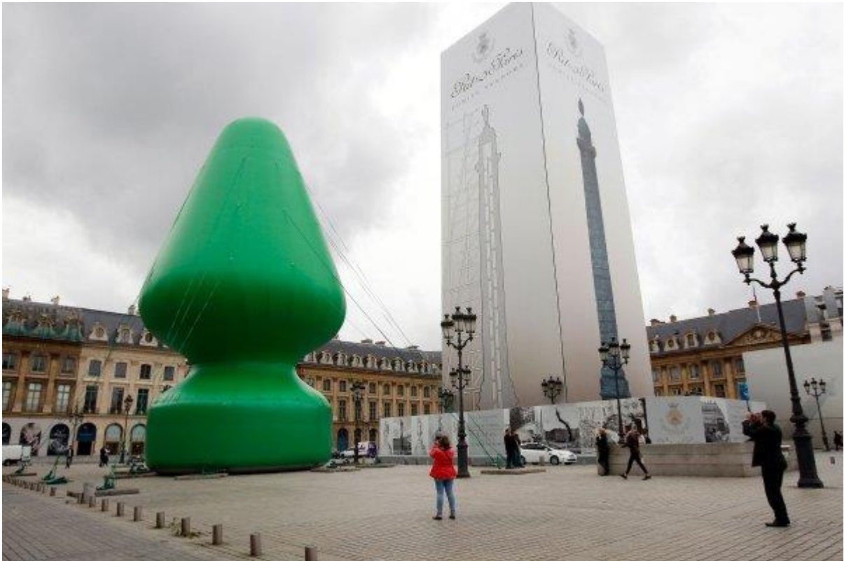
Paul McCarthy, Paris Christmas Tree , 2014

Paul McCarthy est un sculpteur, performeur, et vidéaste américain. Son œuvre a débuté dans les années 1970 autour des thématiques de la culture de masse américaine infantilissante. Il se tourne ensuite vers les objets trouvés dans les années 1980. C'est à partir de 1990 qu'il commence à créer des mannequins réalistes explorant le tabou autour de la sexualité et de la famille. Souvent provocantes et sexuellement explicites, ses œuvres suscitent de nombreuses polémiques, comme son installation de sapin aux allures phalliques l'année dernière sur la place Vendôme de Paris.