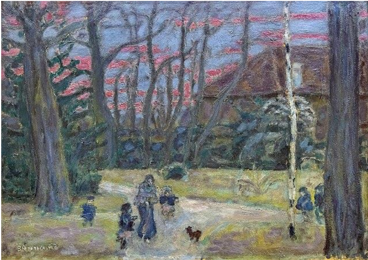
Le soir de Noël , Pierre Bonnard, 1904 huile sur toile - 40,5 x 59 cm

Dans ce tableau, Pierre Bonnard a capturé le soir de Noël. Sa famille profite du jardin et des dernières lueurs du jour. Une scène de famille qui nous rappelle à quel point ces moments sont précieux.