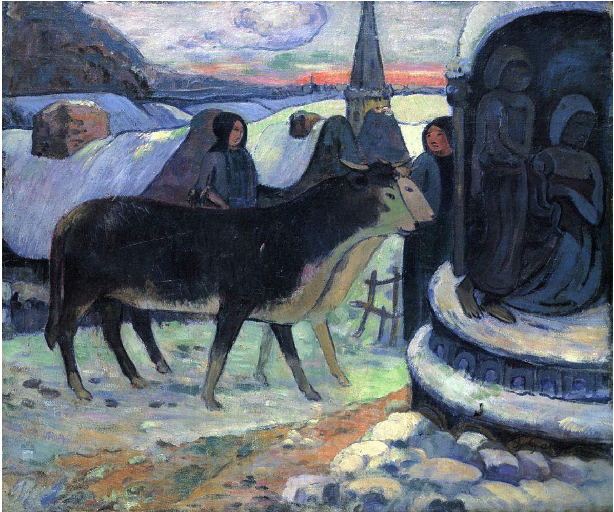
La nuit de Noël , Paul Gauguin, 1902-1903

https://view.genially.com/6425c9b873752d00180f919d