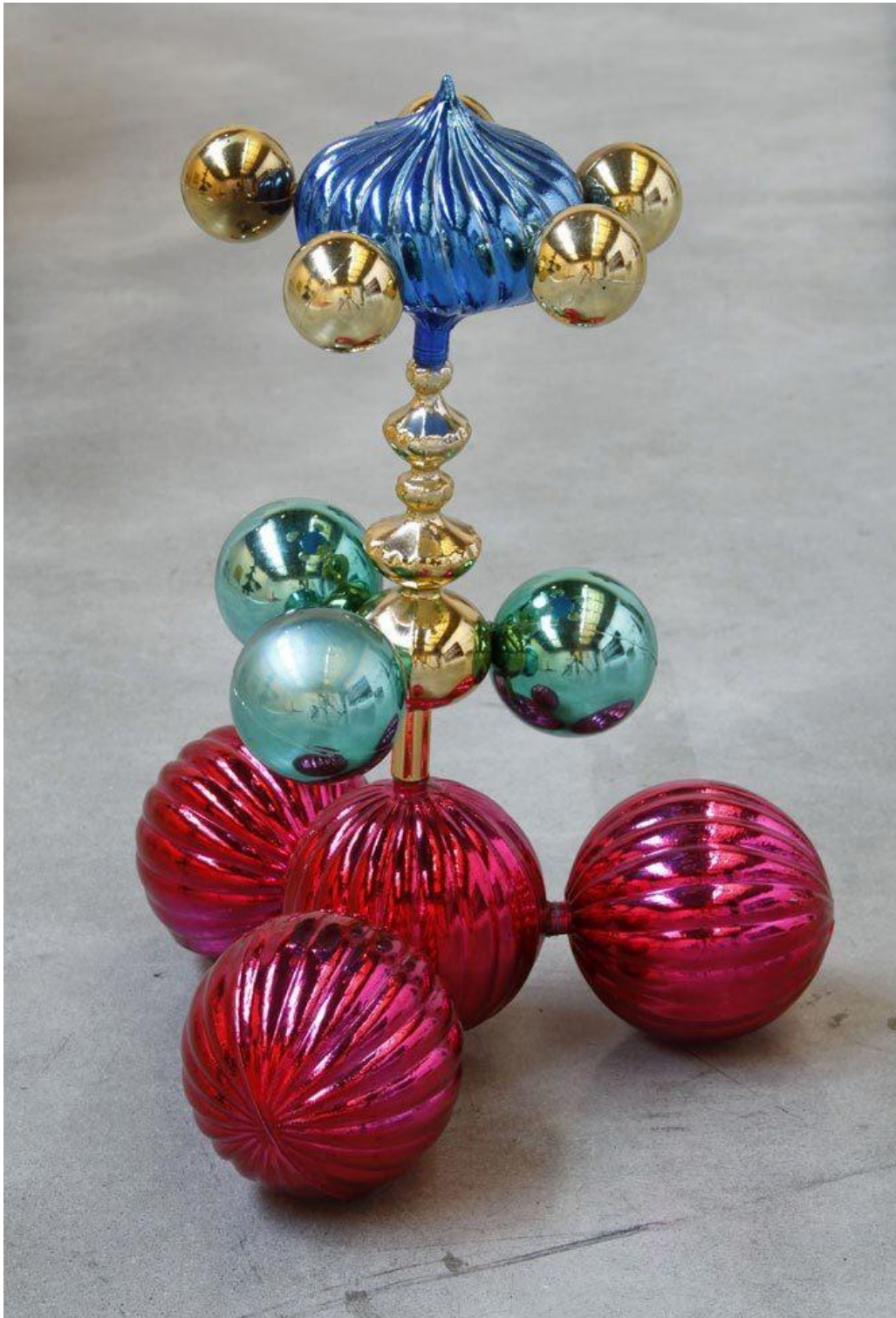
Marepe, Untitled , 2002, décorations de Noël assemblées, sculpture 14½ x 10½ x 10½ in

L'œuvre de l'artiste brésilien Marepe (1970- ) est profondément ancrée dans la tradition et l'histoire de la région de Bahia. Il transforme des objets de la vie quotidienne tels que l'aluminium, des bassines en plastique, des filtres à eau, et des cartes téléphoniques en sculptures. Ces œuvres d'art sont ensuite investies d'une signification poétique et sociale. Sa démarche s'inscrit dans le questionnement du statut de l'objet d'art et la tradition du ready made de Duchamp.