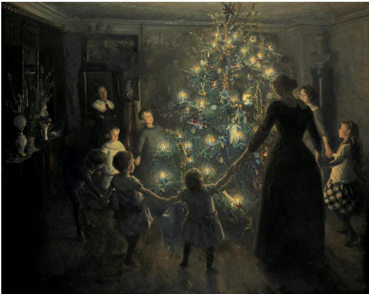
Silent night , Viggo Johansen, 1891, huile sur toile, 127,2 x 158,5 cm

Toutes les bonnes choses ont une fin, alors nous clôturons cette sélection de peintures de Noël sur cette peinture du danois Viggo Johansen.