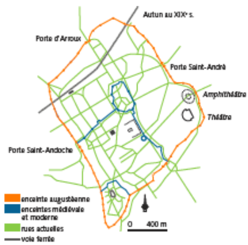
Plan de la ville d'Autun

http://www.autun-tourisme.com/fr/a-voir-a-faire-a-deguster/patrimoine