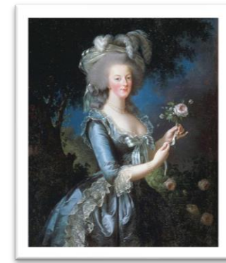
Elisabeth Vigée Le Brun. Marie- Antoinette, 1783

Les modèles se font représenter de plus en plus chez eux, en famille.