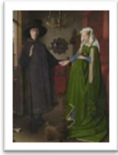
Jan Van Eyck, Portrait des époux Arnolfini, 1434

L'art du portrait connaît un véritable essor et se divulgue rapidement chez les riches et les puissants.