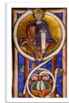
Le comte Alfonso Jourdain, Toulouse

L'individu ne trouve pas sa place dans cet art de la spiritualité et du sacré.