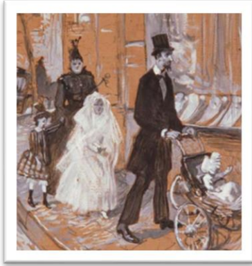
Henri de Toulouse-Lautrec, La première communion (détail), 1888

L'invention et surtout le développement de la photographie permettent de donner l'exact reflet de la réalité.