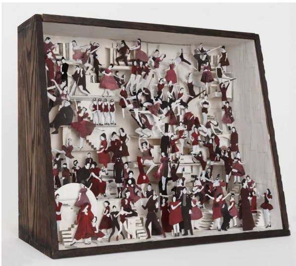
In the theatre on our wedding day, diorama, 2011