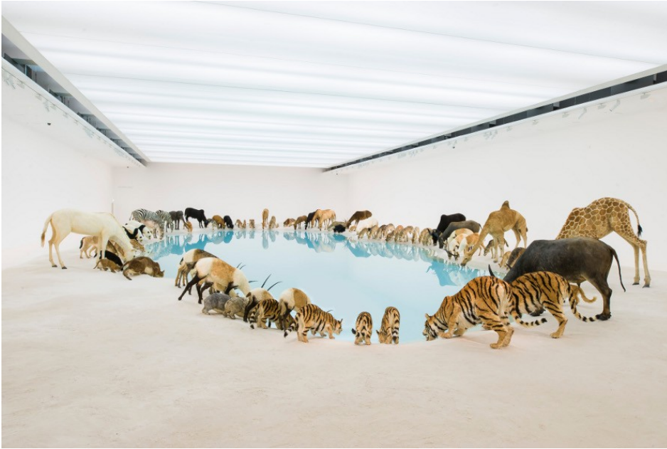
Cai Guo-Qiang, Falling Back to Earth , Galerie Queensland d'Art Moderne en Australie https://roughdreams.fr/2013/12/cai-guo-qiang-falling-back-to-earth/