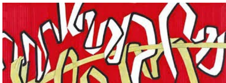
Maxime Descombin, Nomade , Médiathèque de Mâcon

Une exposition en fin d'année permettra de valoriser, mutualiser l'ensemble des réalisations d'élèves. Chaque classe, dans son parcours culturel, viendra découvrir ses propres productions exposées au milieu des réalisations des autres classes inscrites dans le projet. Des activités seront proposées pour que les élèves soient « actifs » et continuent à développer observation, acuité visuelle, rencontre sensible lors de cette visite.