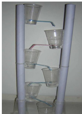
Fontaine en sciences