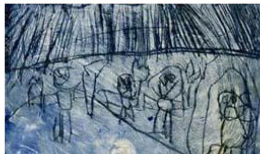
Pont en gravure