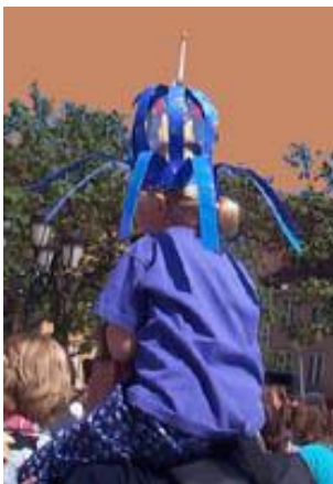
Chapeau-fontaine en arts plastiques