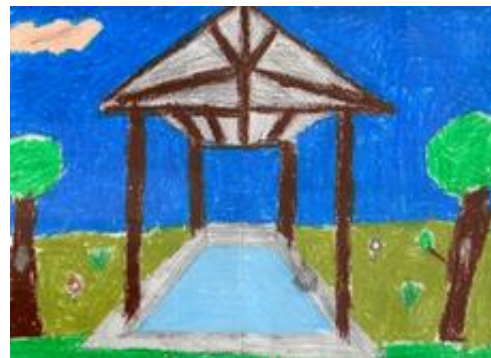
Lavoir, dessin au pastel