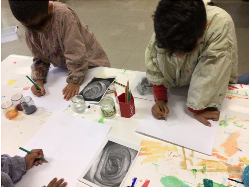
4 - Les élèves remplissent les différentes zones à l'aide des encres colorées mises à leur disposition. L'enseignant leur a préalablement expliqué comment changer de couleur avec le pinceau en rinçant puis en essuyant le pinceau. Les élèves observent les effets de transparence, perçoivent les différentes valeurs d'une couleur par la dilution et observent les effets de fusion lorsque deux couleurs se chevauchent.